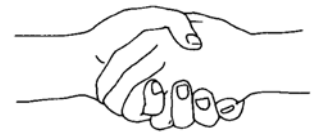
Aperto de mão escutista