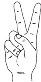
Saudação do Lobito: posição dos dedos