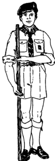
Saudação com vara

Faz-se, quando uniformizado e transportando vara, cruzando o antebraço esquerdo horizontalmente à frente do peito, tocando com os dedos em saudação a vara que deve estar vertical, paralela ao lado direito do corpo, segura com o braço estendido e encostada a meio do pé direito.